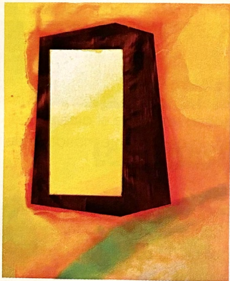
Sans Titre , 2021, technique mixte sur Dibond, 150 x 125 cm.

Le parcours artistique d'Adrien Jutard commence par le dessin (d'immenses formats de traits noirs) pour aller vers la couleur qu'il exploite et rend avec un rare degré de maîtrise dans son éclat, sa pureté, sa dynamique. Depuis quelques années, il utilise des pigments colorés mêlés à de la résine époxy ultrabrillante qu'il couche sur des plaques d'aluminium. Sa nouvelle exposition lyonnaise, « Motifs », résonne avec la soierie, le textile, les tissus. Les chatoyements des couleurs de l'artiste nous plongent dans l'univers de la mode des seventies. Adrien Jutard s'est également consacré à la sculpture, utilisant le carbone et les laques qu'il découvre dans l'industrie du sport (le surf et ses dérivés).